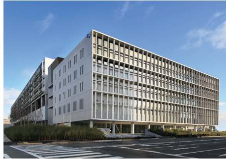
② 東京本社 | 東京都江東区新砂2-2-8 TEL (03) 3699-3666