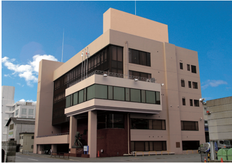
① 本社 | 京都府京都市南区上鳥羽角田町68 TEL (075) 691-6500