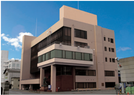
① 本社 | 京都府京都市南区上鳥羽角田町68 TEL (075) 691-6500