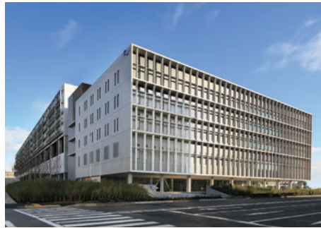
② 東京本社 | 東京都江東区新砂2-2-8 TEL (03) 3699-3666