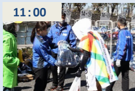
フィニッシュエリアの大手町で手荷物返却業務を実施 (スタートエリア同様、ここでも大勢のボランティアさんと一緒に実施)