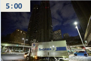
スタートエリアの都庁に大型トラック45台以上が集結