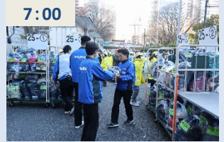
ランナーの手荷物預かりスタート (大勢のボランティアさんと一緒に実施)