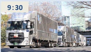
手荷物預かり終了後、フィニッシュエリアへ先回りするため、都庁から大手町に向けてトラック移動開始