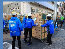
15カ所の給水ポイントに、給水・給食品を輸送